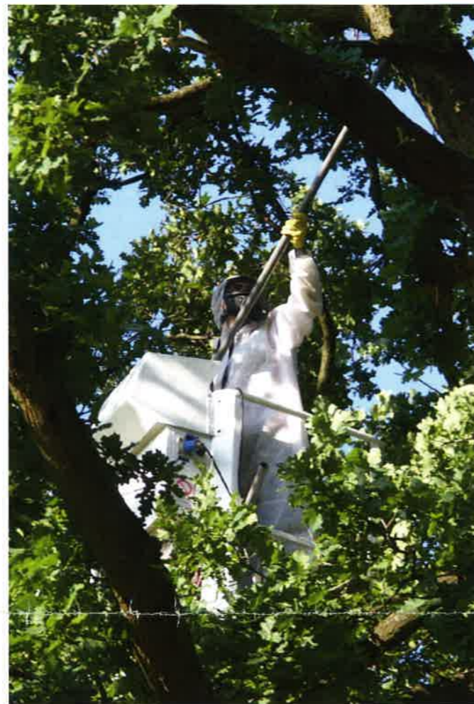
Abbildung 12: Professionelle Entfernung der Gespinnstester

Für Informationen rund um den Eichenprozessionsspinner sowie die zugelassenen Mittel nach Pflanzenschutz- und Biozidrecht wenden Sie sich bitte an die örtlichen Beratungsförster und -innen der Ämter für Ernährung, Landwirtschaft und Forsten.