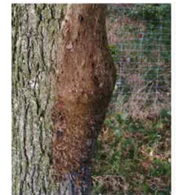
Abbildung 5: Frisches Verpuppungsnest

Ab diesem Stadium ziehen sich die Raupen tagsüber in die mit Kot und alten Larvenhäuten gefüllten Gespinnstester am Stamm und in Astgabelungen zurück. Diese enthalten oft mehrere Tausend Raupen. Bei der Nahrungssuche bilden sie mit bis zu 30 Tieren nebeneinander bandförmige Prozessionen von bis zu 10 m Länge.