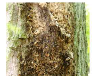
Abbildung 6: Ältere Gespinnstreste

Männliche Raupen durchlaufen fünf Raupenstadien, weibliche sechs. Ab Mitte Juni bis Anfang Juli verpuppen sich die Altraupen. Dazu spinnen sie sich in feste, dicht gedrängte, ockerfarbene Kokons im Gespinnstest ein. Die Puppenruhe dauert drei bis fünf Wochen. Nach dem Falterschlupf bleiben die Gespinste aus Spinnfäden, Häutungsresten, Raupenkot und Puppenhüllen über Jahre am Baum erhalten.