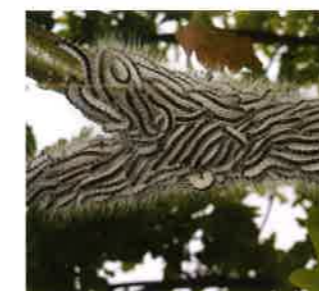
Abbildung 3: Prozession der Altraupen

Die Raupen schlüpfen Ende April/Anfang Mai. Sie sind zunächst rotbraun und schließen sich gleich nach dem Schlupf zu den typischen »Prozessionen« zusammen. Tagsüber und zur Häutung bilden die Raupen nestartige Ansammlungen aus locker versponnenen Blättern und Zweigen, abends wandern sie in Prozessionen zum Fressen in die Eichenkronen.