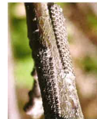
Abbildung 2: Eigelege

Ein Weibchen legt durchschnittlich 150, ca. 1 mm große, weiße Eier ab. Das Gelege hat die Form einer länglichen Platte und wird mit grauen Afterschuppen und Sekret bedeckt. Die Eiablage erfolgt vorwiegend im oberen Kronenbereich der Eichen an ein- bis zweijährigen Zweigen. Der Embryo entwickelt sich bereits im Herbst, die fertige Jungraupe überwintert noch im Ei und kann dabei tiefe Wintertemperaturen bis zu -28 °C unbeschadet überstehen.