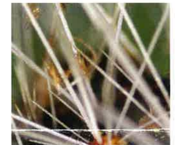
Abbildung 4: Brennhaare

Nach der ersten Häutung sind die Raupen grau, haben eine dunkle Rückenlinie und lange, silbrige Haare. Ab dem dritten Raupenstadium werden zusätzlich die lediglich 0,1 mm kurzen Brennhaare ausgebildet, die bei Kontakt akute Gesundheitsbeeinträchtigungen verursachen können.